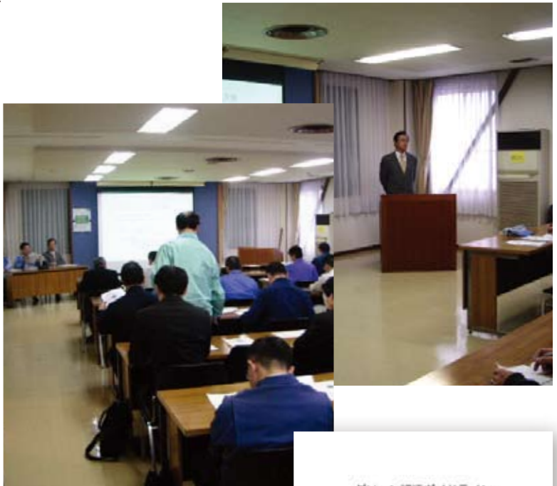
グリーン調達ガイドライン説明会