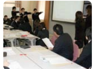
新入社員導入教育

学生から社会人への意識の切り替えを徹底させるとともに大豊社員として必要な知識の習得を行っています。