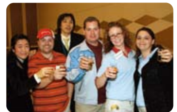
グローバルQC大会交流会