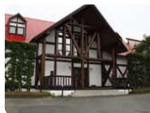
三ヶ日研修所 燦々ログ三ヶ日