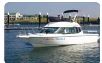
会社所有船舶 Sun Sun TAIHO II