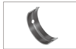
エンジンベアリング