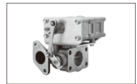
バタフライ式 EGRバルブ