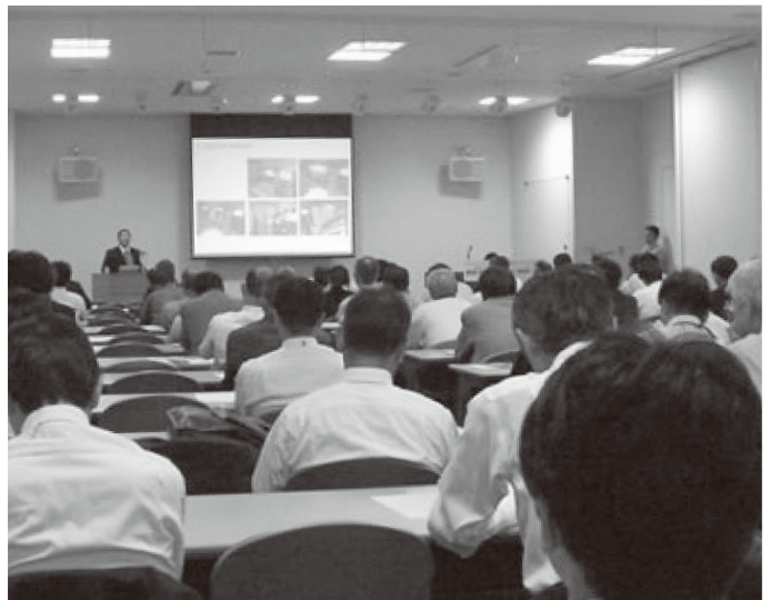
エコアクション21認証登録企業見学会 (6月)