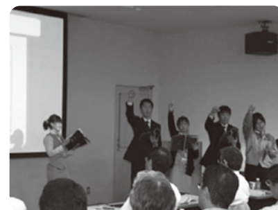
国内大豊グループQC大会（11月）