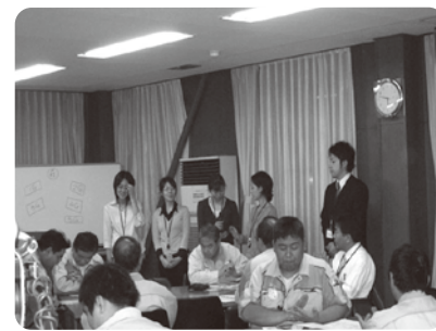
メタボ打破キックオフセミナー