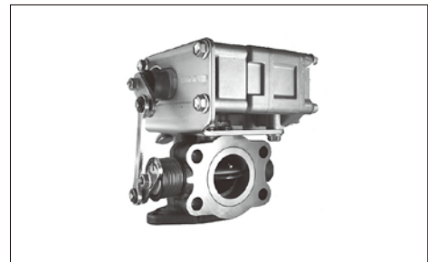
バタフライ式EGRバルブ

当製品は、日野自動車(株)の中・大型トラックのエンジンに搭載されており、排気ガス中の窒素酸化物 (NOx) 低減や燃費向上を目的とし、排気ガスの再循環量制御を行うものであり、規制がますます厳しくなっていく環境下において、大変重要な役割を担っています。