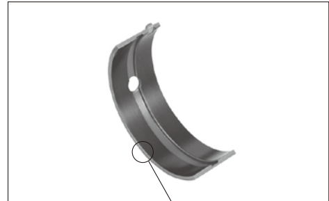
RAコーティング エンジンベアリング

固体潤滑オーバーレイにより鉛フリー化とオーバーレイの新しいコンセプトを創成したこと、従来鉛合金軸受が使われていた高性能エンジン向けに世界的に採用が進んでいること、鉛合金軸受に比べCO 2 排出量を40%低減できることなどが総合的に評価されたものです。