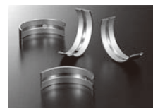
エンジンベアリング