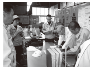
細谷工場 審査風景