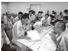
本社工場 内部監査