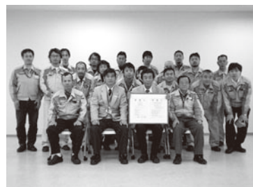
認証取得の記念撮影