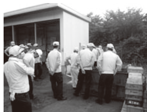
幸海工場 内部監査