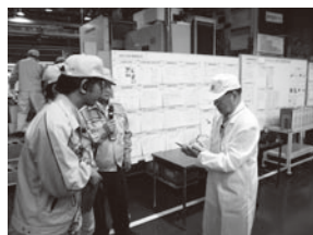
篠原工場 審査風景

環境マネジメントシステム(以下EMS)が適切に運用されているかどうか、外部機関による審査を毎年受けています。2009年度は大豊岐阜(株)を含めた審査を受けました。その結果、EMSが適切に運用されていることが確認され、大豊岐阜(株)を含めた登録が更新されました。