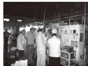
(株)ティーイーティー 内部監査