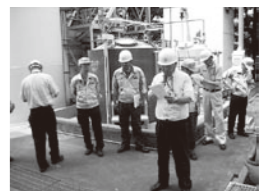
細谷工場 工場長による点検