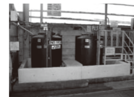
本社工場 対策事例 (廃液流出防止の防液堤)

2009年度は「環境事故を絶対に起こさない」というキーワードを柱とし、様々な事故事例を未然防止対策に役立てるため、工場を中心に展開してきました。各環境法令に関わる測定・分析も継続的に行っています。