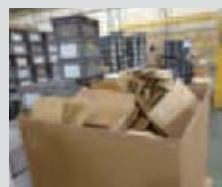
余ったダンボールなど