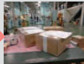
小口製品の出荷に使用