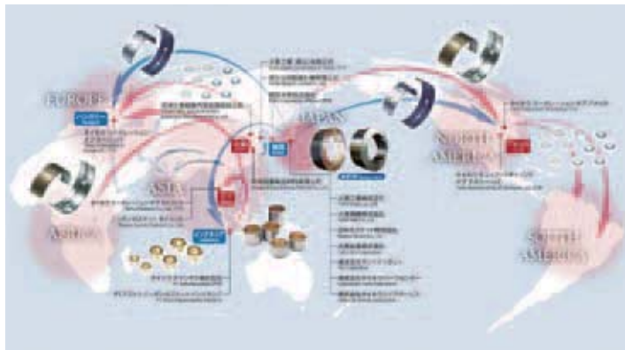
グローバルな事業活動イメージ図

2015年度から大豊グループで地球温暖化防止活動を開始するため、CO 2 削減目標値を設定します。