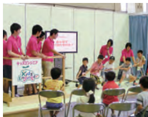
キッズエンジニア2014

また、豊田少年少女発明クラブや、キッズエンジニアなど、青少年育成の場にも従業員が講師となって参画しています。