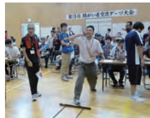
第13回 障がい者交流ダーツ大会

障がい者の方々の触れ合いの場、社員のボランティア意識の向上を目的とした当社主催のイベント「障がい者交流ダーツ大会」などを毎年開催しています。