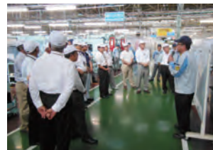
工場見学(篠原工場)