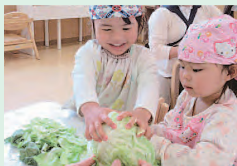
キャベツを使った食育カリキュラム