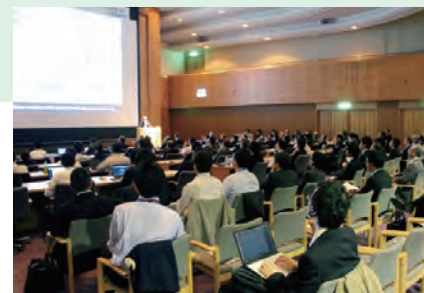
第2回 国際シンポジウム(名古屋国際会議場)

2017年4月19日、名古屋国際会議場でTTRFと共催で第2回国際シンポジウムを開催し、当日は約160名の国内外のトライボロジー関係者に来場いただきました。第1回目はトライボロジーを俯瞰的に議論しましたが、今回の第2回目はパワートレインの摩擦低減技術にテーマを絞り、且つ産学両者からの視点で意見交換できるプログラムとしたことで、より活発な討議を行うことができました。今後もTTRFへの支援を通じて、継続的なトライボロジー技術の発展と社会の発展に貢献します。