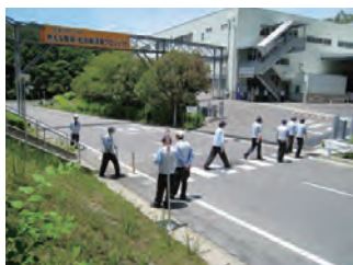
ポケテナシ活動の様子

6月から7月にかけて、安全月間行事を実施しています。2016年度は、「全役員参加の工場安全点検」、「KY大会」、「ポケテナシ活動」などを実施し、安全・安心な職場の風土づくりを進めています。