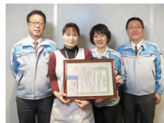
当社担当役員と衛生部門スタッフ

生活習慣の改善に取り組むため、健康づくりキャンペーンを継続して実施しています。各々が達成目標や取り組みを宣言して進めるこの活動は、トヨタ関連部品健康保険組合より3年連続で取り組み賞を受賞しています。