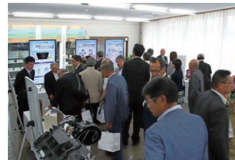
株主懇談会(技術展示)