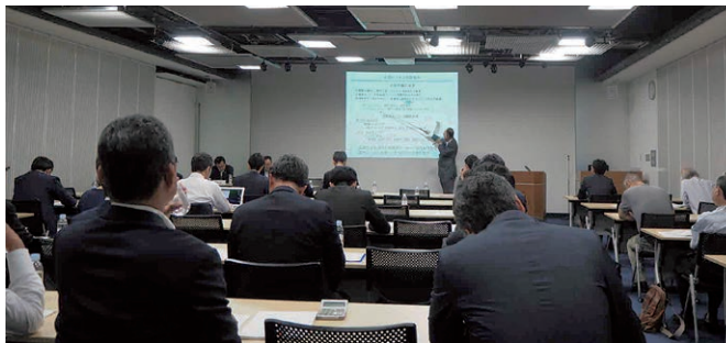
決算説明会(5月28日/東京)

5月、11月に東京で決算説明会を実施しており、機関投資家、証券アナリストを対象に、当社の決算概況および持続的成長に向けた取り組みについて情報提供を行っています。