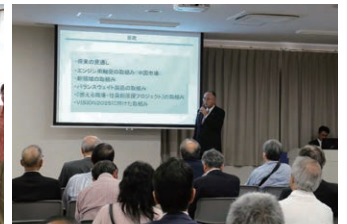
株主懇談会(社長プレゼン)