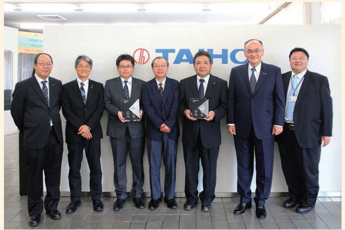
GM Supplier Quality Excellence Award