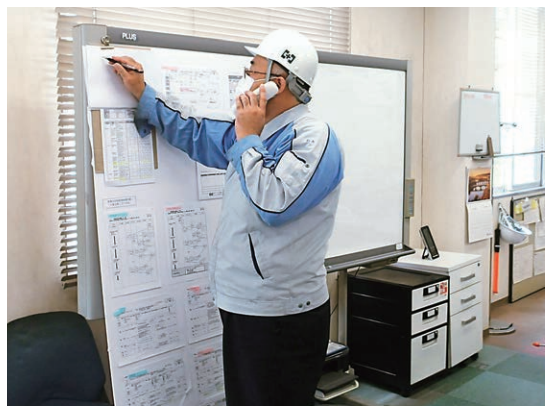
BCM本社訓練 情報収集状況