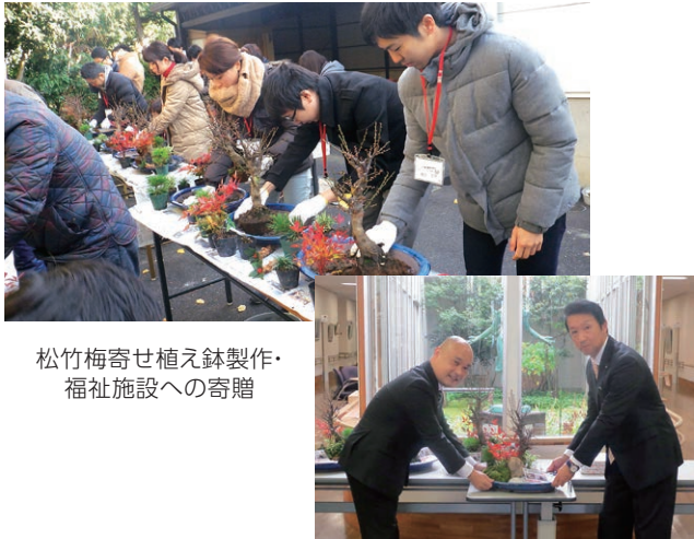
松竹梅寄せ植え鉢製作・福祉施設への寄贈

「一人でも多くの方に地域貢献活動の理解と関心を」と推進し、執行役員や従業員が積極的にボランティア活動に参加。従業員の社会貢献活動を支援し、地域とのコミュニケーションの場づくりを提供します。