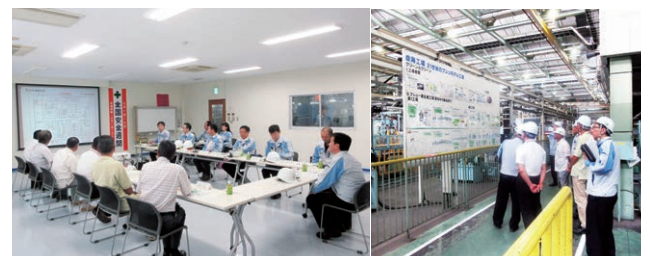
自治区 懇談会・工場見学会