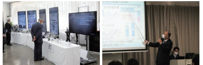
株主懇談会(技術展示)