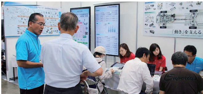
名証IRエキスポ2019(名古屋)