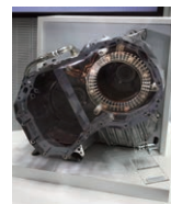
駆動モーター用 冷却製品