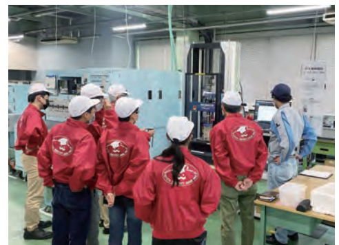
豊田市少年少女発明クラブへの支援