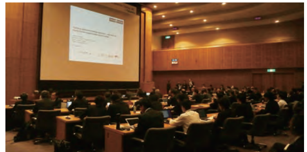
自動車のトライボロジーに関する国際シンポジウム

2023年4月13日にはTTRFと大豊工業共催で「第6回自動車のトライボロジーに関する国際シンポジウム」をオンサイト開催しました。140名を超える参加者を迎え「100年に一度の大変革期を生き抜くトライボロジー材料の将来展望PartⅡ～表面処理～」をテーマに、高度な情報交換と産学連携の強化につながる活発な討議を行うことができました。