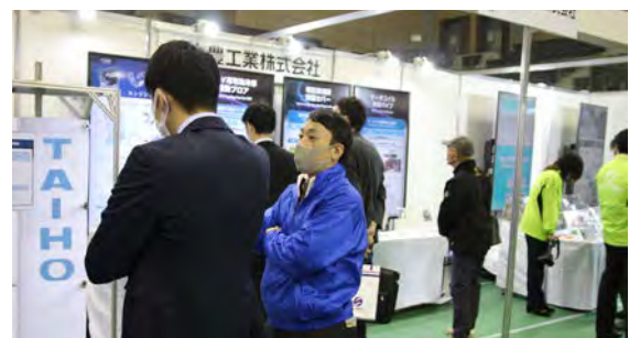
とよたビジネスフェア