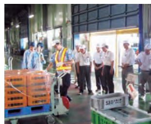
工場見学(篠原工場)