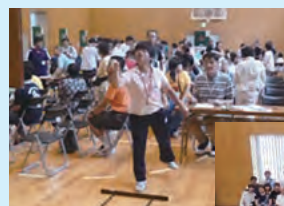
第13回 障がい者交流ダーツ大会

当社主催の障がい者交流ダーツ大会は13回目を迎えることができました。豊田市や社会福祉協議会の後援をいただき、豊田市内の多くの障がい者の方々にダーツ競技を楽しんでいただいております。社員も障がい者の方々と大会を通じて触れ合うことで、ボランティア意識の向上に繋がっております。今後も、より一層、競技参加者に楽しみと喜びの機会を提供するために尽力していきます。