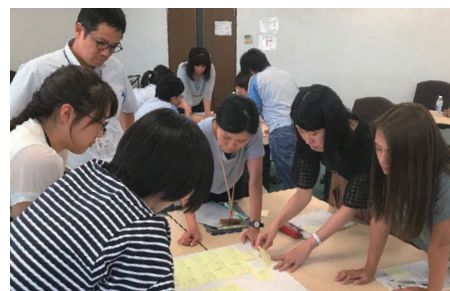
元気shineプロジェクト 女性活躍定例会