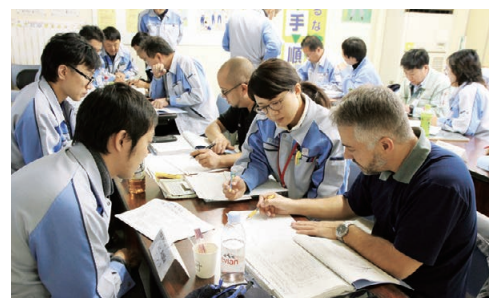
元気工場プロジェクト グローバル推進会議