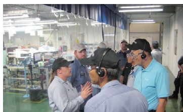
元気工場プロジェクト 海外拠点視察(北米)