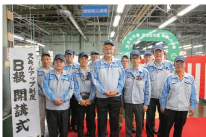
スキルアップ制度B級開講式

より快適な職場を目指し、自ら改善する「楽しみ」や「メリット」を実感させてモチベーションアップにつなげていく活動です。2017年から始まったスキルアップ制度では、2018年6月にB級がスタートし、篠原工場の道場で開講式を実施。第2ステップに進展し、「教え、教えられる風土」の醸成に一步前進しました。