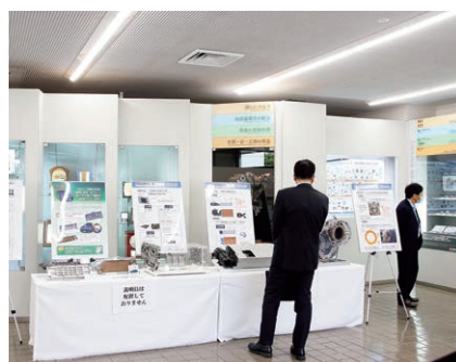
株主懇談会(技術展示)