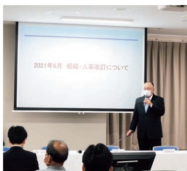
株主懇談会(社長プレゼン)